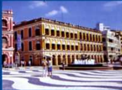
●世界遺産セナド広場 市街中心となる石畳の広場。民政総署、警察署などが広場を囲み、マカオ社会の多文化共生を示す一方、バスターミナル、新古典様式の建物が街の雰囲気を演出する。