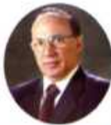
マカオ政府観光局 局長 エンジンニア・ジョアン・コスタ・アントゥネス

エネルギーを発掘をつづける一方で、大航海時代のロマンを感じられるエキゾチックなマカオへ是非お出かけください。